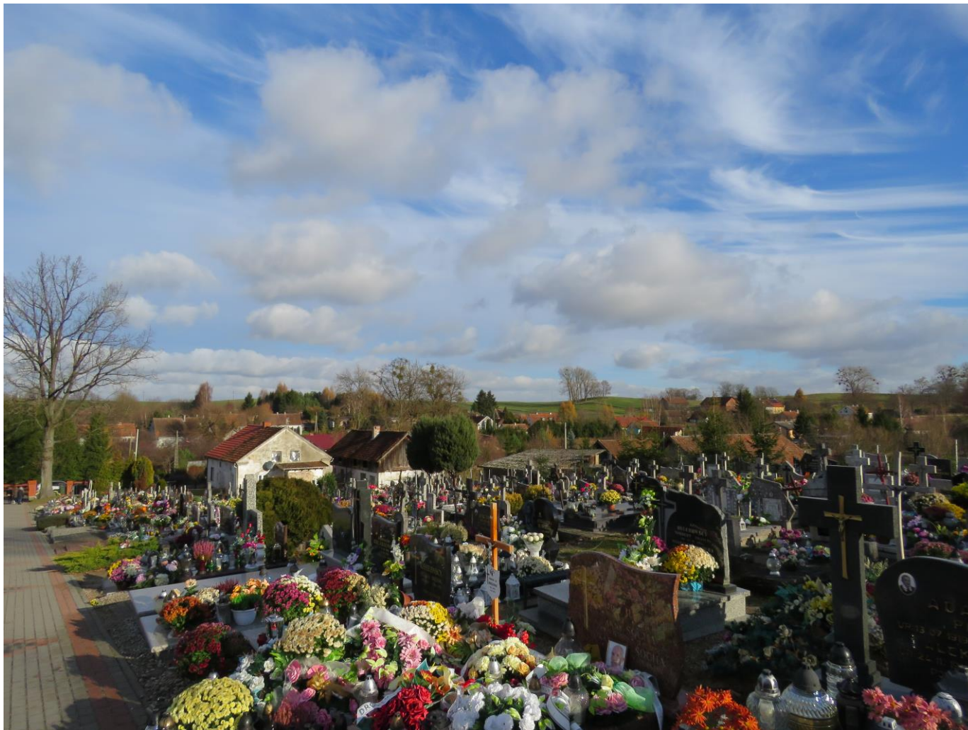
Widok wnętrza cmentarza z SW na NE