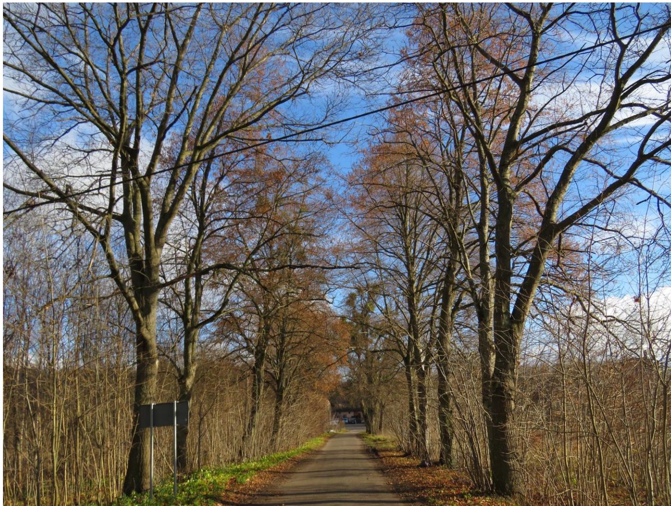
Widok alei z W na E

7. Fotografia z opisem wskazującym orientację w stosunku do sąsiednich terenów lub stron świata albo mapa z zaznaczonym stanowiskiem archeologicznym: