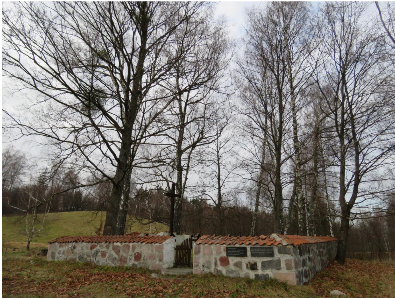
Widok cmentarza z SE na NW

Rejestr zabytków: A-2357 z 29.01.1988 r.