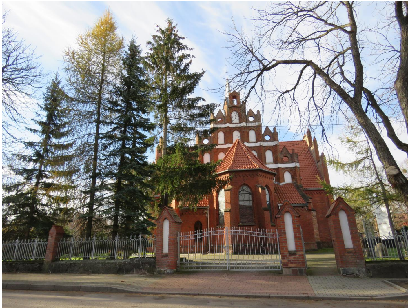
Widok ogrodzenia z E na W

7. Fotografia z opisem wskazującym orientację w stosunku do sąsiednich terenów lub stron świata albo mapa z zaznaczonym stanowiskiem archeologicznym: