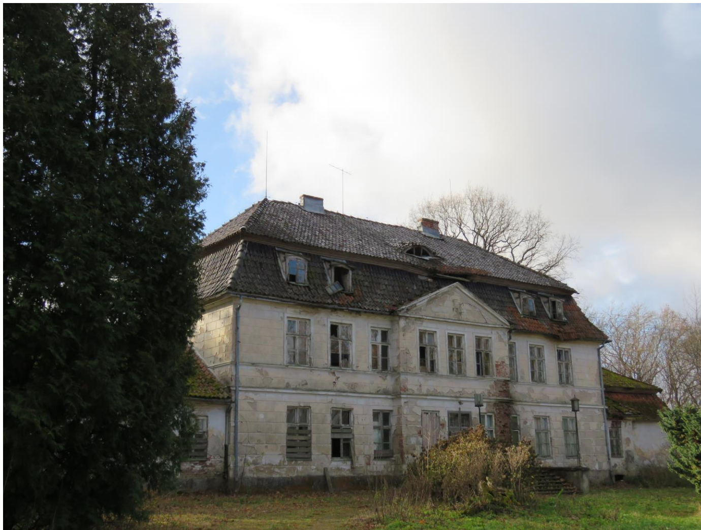
Fasada ogrodowa z NE na SW

7. Fotografia z opisem wskazującym orientację w stosunku do sąsiednich terenów lub stron świata albo mapa z zaznaczonym stanowiskiem archeologicznym: