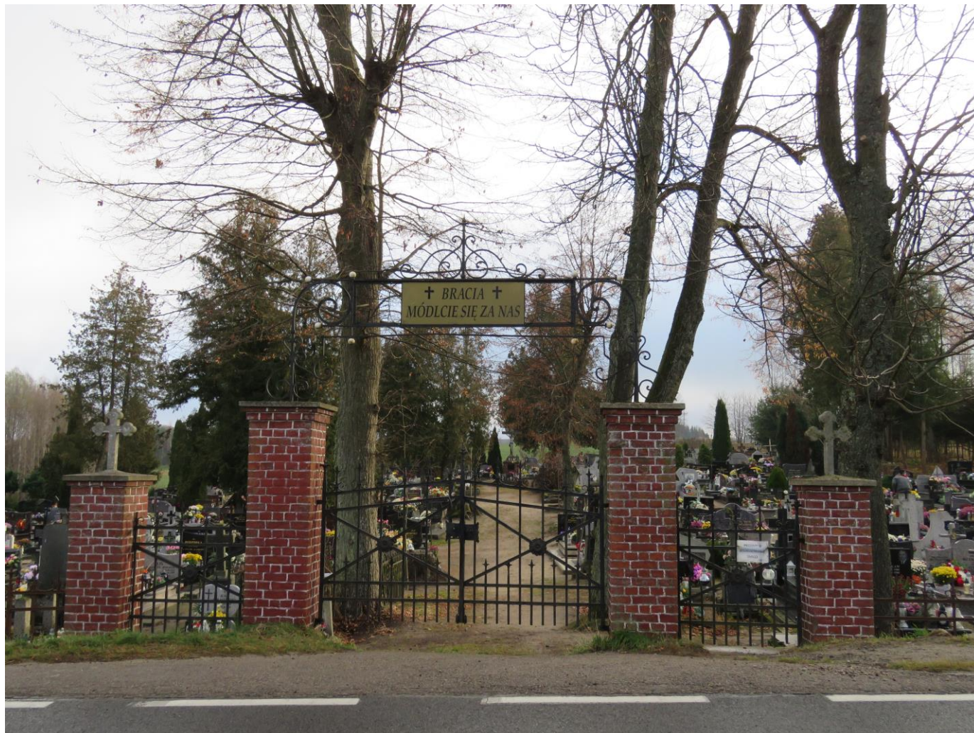
Widok bramy z W na E