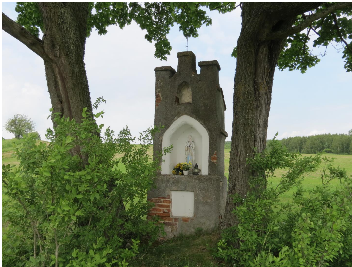
Ściana frontowa i boczna z SE na NW