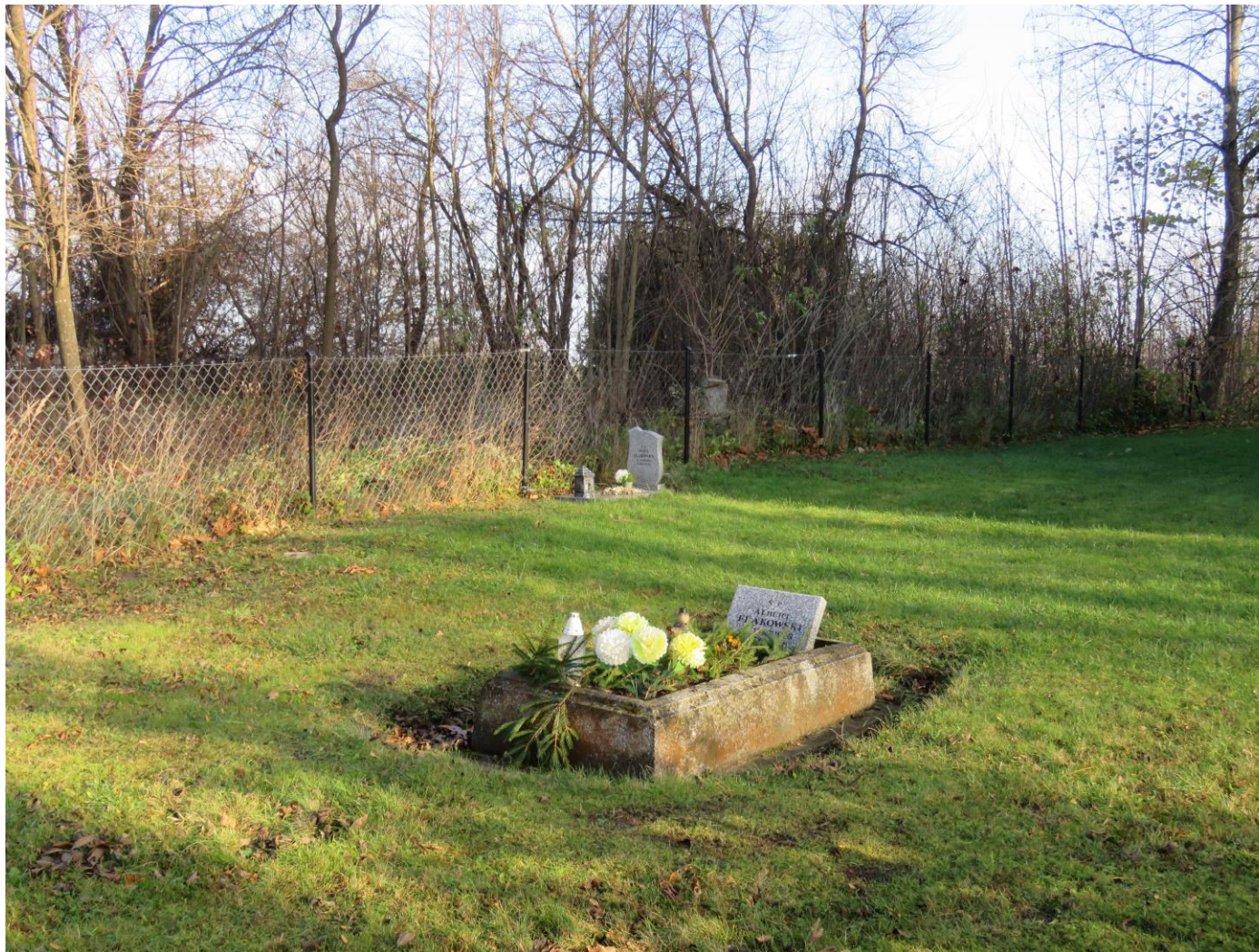
Widok cmentarza z SW na NE