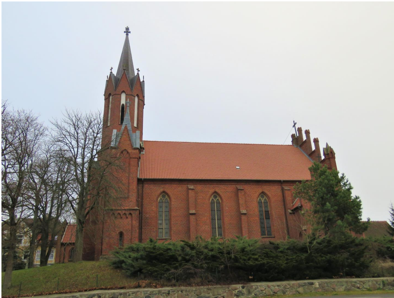
Widok kościoła z S na N

7. Fotografia z opisem wskazującym orientację w stosunku do sąsiednich terenów lub stron świata albo mapa z zaznaczonym stanowiskiem archeologicznym: